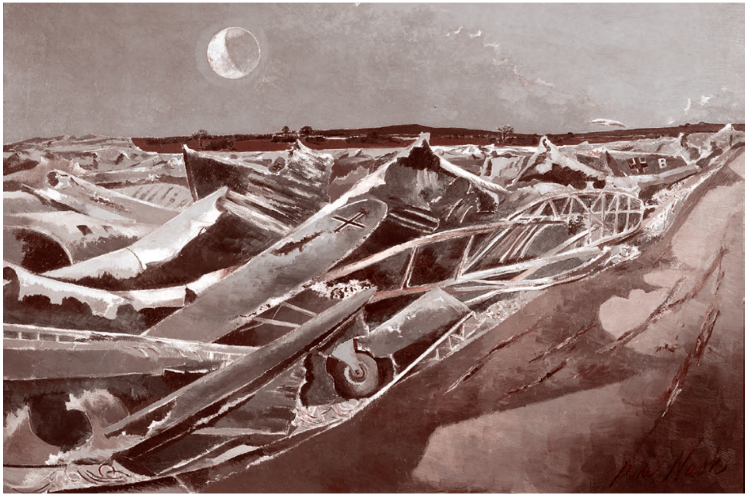
Пол Нэш. Мертвое море. 1941

Есть ли связь между аномально жарким летом 1940 года и разгромом Франции? Этот вопрос повторяется в ходе спектакля... И на него так сразу не ответишь. Разгромлены и Франция, и лето. В них вселилось порча, смерть, зерно поражения, убивающее все на своем пути, куда ни внедрится, — вот какую связь видят ведущие. Неподготовленные летчики Франции пытаются безуспешно сражаться с врагом, гибнут. Оставшиеся в живых раздавлены этим фактом. Как говорит один из персонажей, им поручено тушить огромный пожар парой стаканов воды. А здравый смысл подсказывает, что это невозмож-