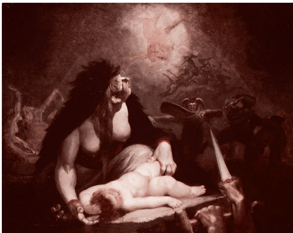
Иоганн Генрих Фюссли. Визит ночной ведьмы. 1796

Ответ на этот вопрос очевиден. Если живые, деятельные люди не смогут прозреть и ощутить, куда именно их волокут нынешние тенденции, то никакого ответа на вызов этих тенденций не будет, и они возобладают. Возобладав же, приволокут мир в состояние более страшное, нежели то, в котором мир мог бы оказаться, если бы победил Третий рейх. Ну и зачем тогда нужно было его побеждать? Зачем нужна была та жертва на алтарь победы