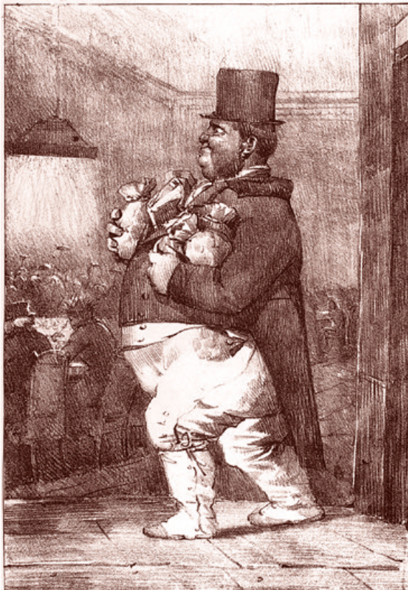
Никола-Туссен Шарле. Лорд Толстые Щёки. 1820-1822