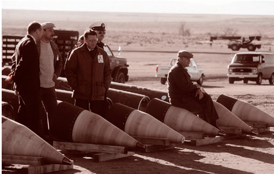
Советские инспекторы и американские сопровождающие среди разобранных ракет «Першинг-2» наблюдают за уничтожением их компонентов, 14 января 1989

передового базирования (Forward Based System). Однако на первом этапе она пока не включала в себя размещения ракет средней дальности. Зато у американцев уже были развернуты в ФРГ ракеты малой дальности «Першинг-1А», позволявшие атаковать цели на расстоянии до 740 км.