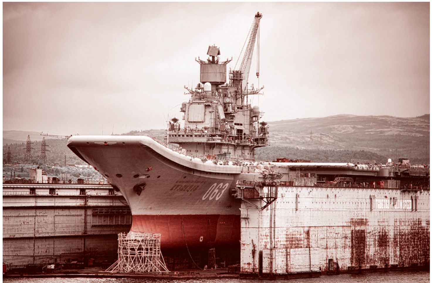
«Адмирал Кузнецов» в плавучем доке ПД-50. Июнь 2015.