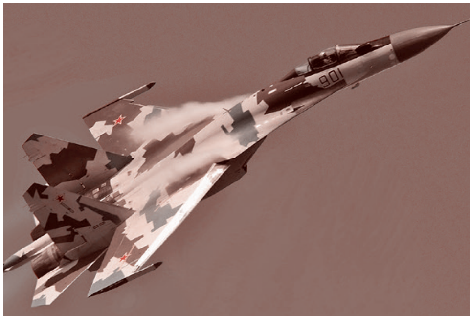
Су-35 в полете. 2017

Усиление торговой войны между США и Китаем приведет к «холодной или геополитической войне», которая отразится на всех странах мира, такое заявление сделал соучредитель и исполнительный вице-председатель китайского гиганта электронной торговли Alibaba Джозеф Цай.