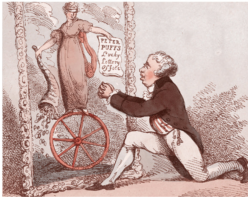
Томас Роулендсон. Молитва управляющего лотерейного офиса. 1801

Глава Минфина Силуанов поспешил заверить участников заседания в том, что