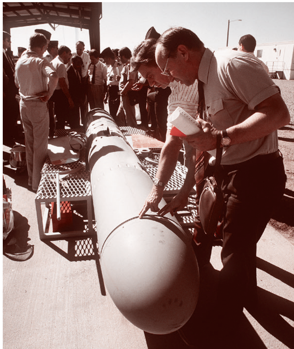
Советский инспектор осматривает американскую ракету BGM-109G «Томагавк» подлежащую утилизации. 18 октября 1989

к слову, является одним из авторов того самого «Обзора ядерной политики», описывает военно-политические изменения за прошедшие годы, утверждая, что в военной стратегии США существует чрезмерный разрыв между конвенциональными средствами поражения и стратегическими ядерными. И сетует, что этот разрыв позволяет «соперникам» США (России и Китаю) вести себя более агрессивно без опасения полномасштабного ответа со стороны американцев, которые, конечно же, не желают всеобщей ядерной эскалации.