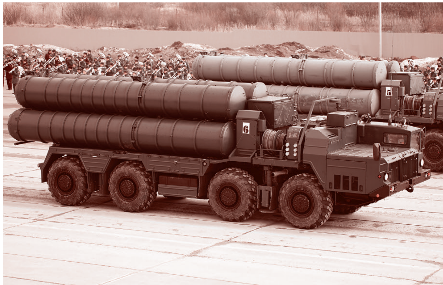
Пусковая установка 5П85СМ2-01 из состава ЗРК С-400

Помимо лежащей на виду и бьющей через край радости Рособоронэкспорта по поводу сумм контрактов, заключенных с Китаем, в этой новости есть любопытный малозаметный нюанс. Известно, что Китай успешно наладил серийное производство «клонов» наших боевых самолетов Су-27 и зенитных ракетных комплексов С-300П. А главные отличия более совершенных отечественных самолетов Су-35 и ЗРК С-400 от своих предшественников состоят в том, в чем — как считается — Китай уже безоговорочно сильнее нас, т.е. в электронике. И вдруг оказывается, что Китай почему-то закупает у России и Су-35, и С-400, а не «доводит» самостоятельно электронику их старых модификаций. Получается, что либо Китай серьезно перехвалили, либо об уровне развития собственной электроники мы чего-то не знаем.