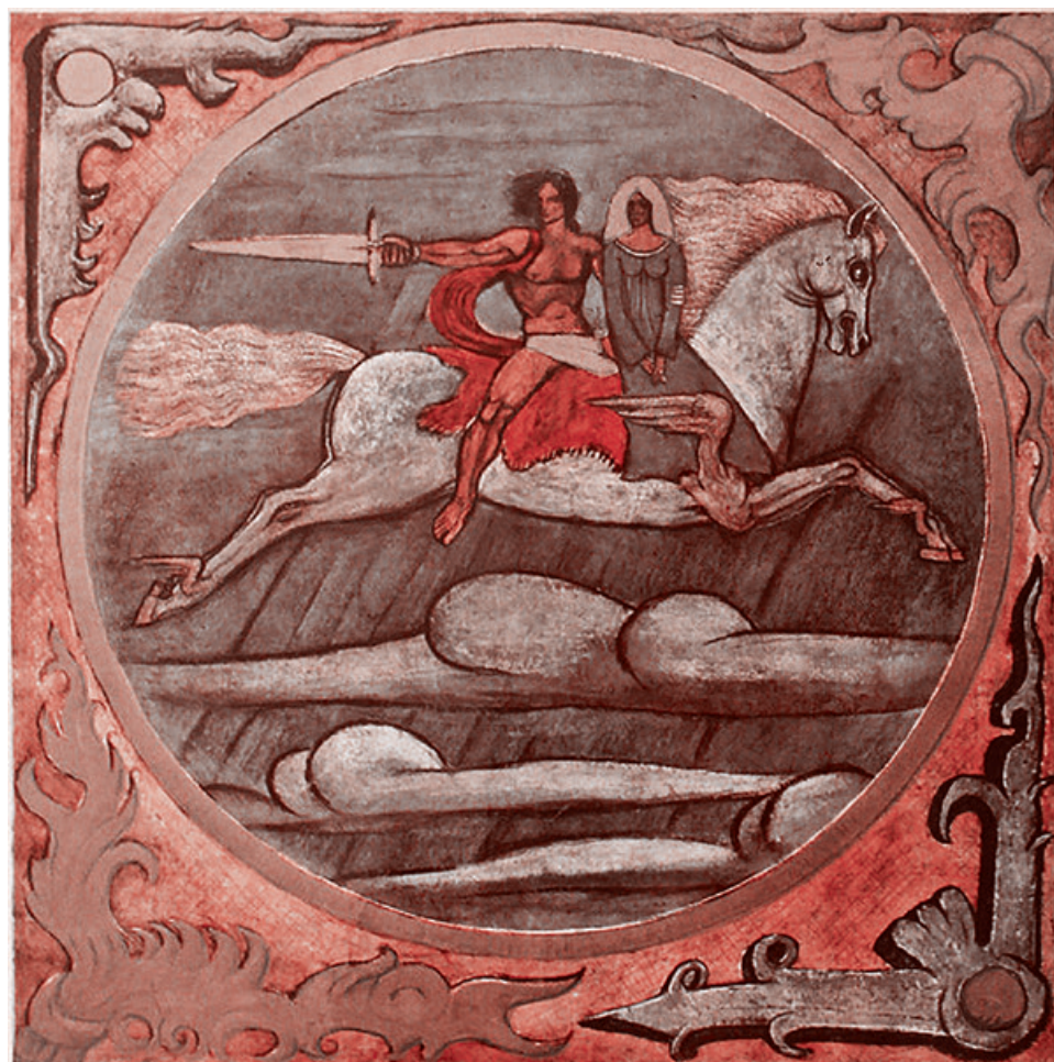
Рисунок Амирани на обложке книги. 1975