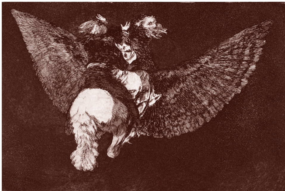
Франсиско Гойя. Летающая глупость. Ок. 1816–1823

При этом представители киевской хунты предлагают новые способы вовлечения силовых структур Запада в военное противостояние с Россией.