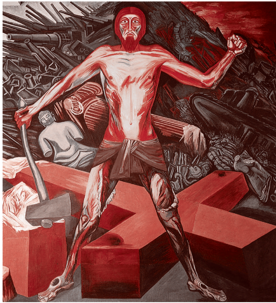
Хосе Клементе Ороско. Современная миграция Духа. 1932–1934

Что же касается катехона, то русские считают им себя всегда и постоянно. А Маркс считал таким катехоном комму-