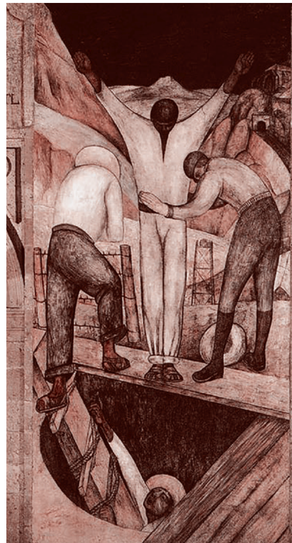
Диего Ривера. Выход из шахты. 1923