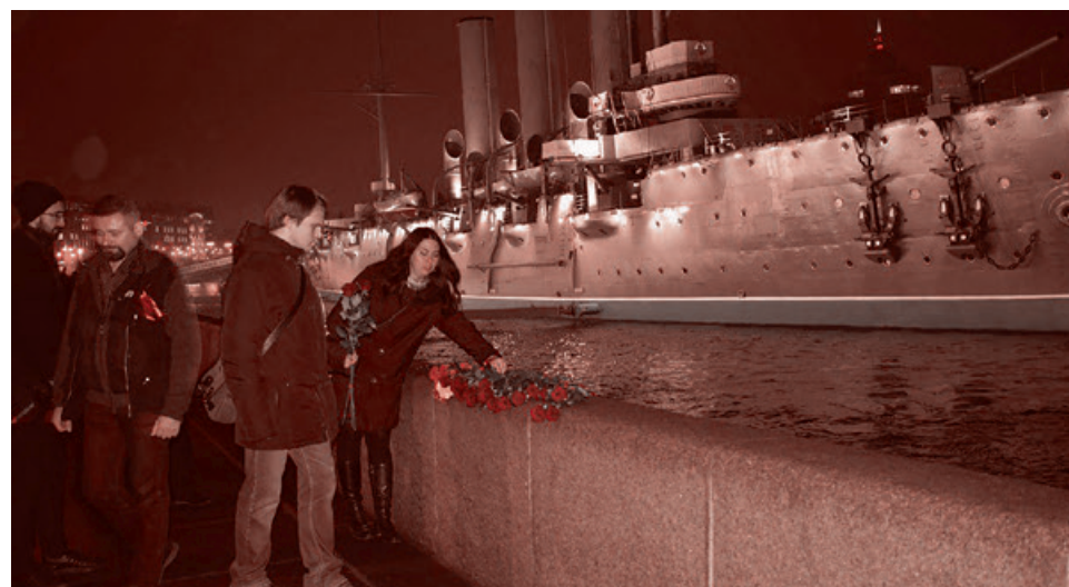
Цветы у крейсера «Аврора». 7 ноября 2018

Местные власти относятся к празднику противоречиво — где-то информация размещена на официальных сайтах и даже заявлено о поддержке мероприятий мэрией, где-то акции не согласованы по надуманным