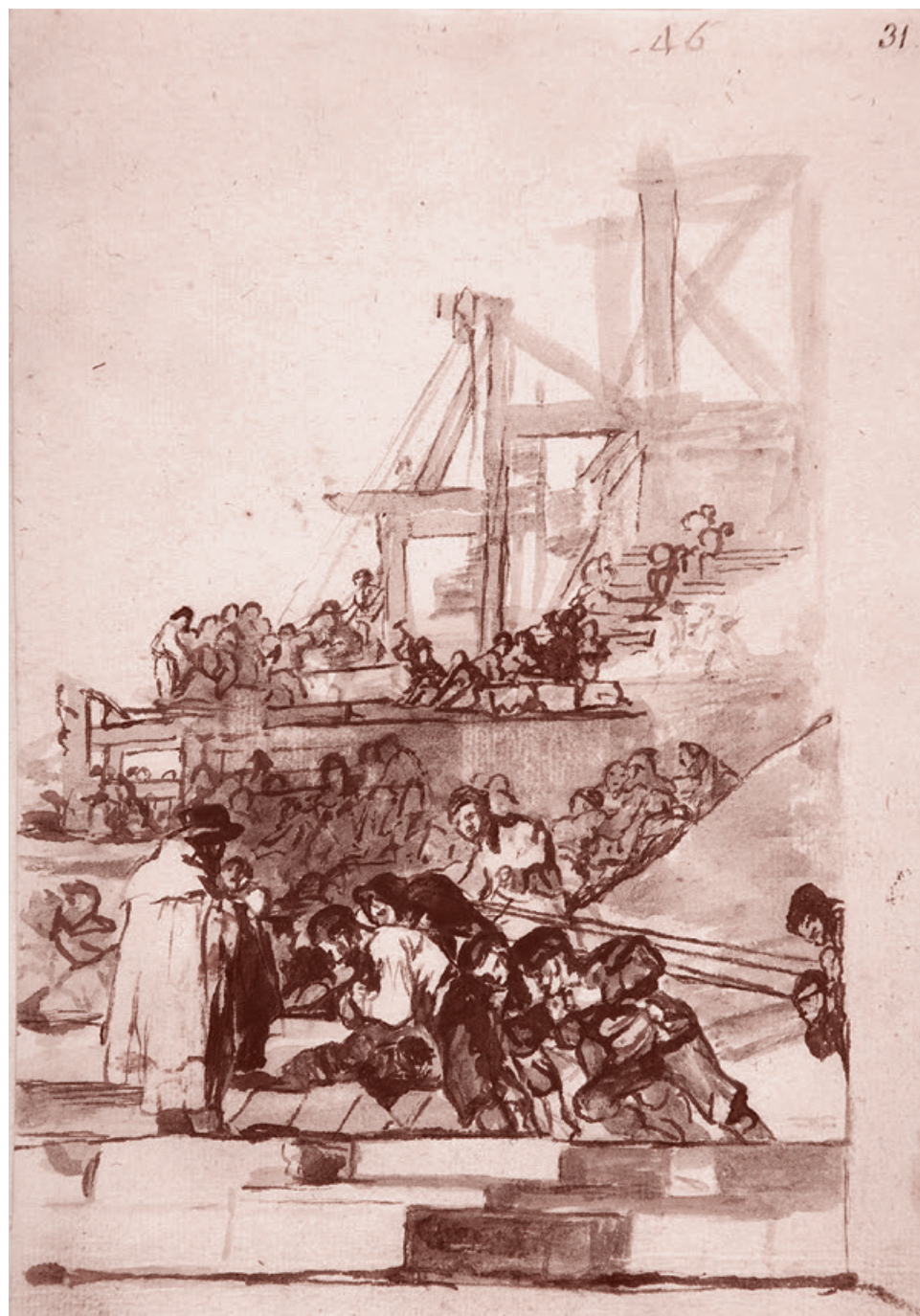
Франсиско Гойя. В процессе строительства. Ок. 1812–1820

В своем письме Боткину Белинский, называя Гегеля «Егором Федорычем», так отвергает то гегельянство, которому доселе яростно поклонялся: «Мне говорят: развивай все сокровища своего духа для свободного самонаслаждения духом, плачь, дабы утешиться, скорби, дабы возрадоваться, стремись к совершенству, лезь на верхнюю ступень лестницы развития, — а споткнешься — надай — черт с тобой — таковский и был сукин сын... Благодарю покорно, Егор Федорыч, — кланяюсь вашему философскому колпаку; но со всем подобающим вашему философскому филистерству уважением честь имею донести вам, что если бы мне и удалось влезть на верхнюю ступень лестницы развития, — я и там попросил бы вас отдать мне отчет во всех жертвах условий жизни и истории, во всех жертвах случайностей, суеверия, инквизиции, Филиппа II и пр. и пр.: иначе я с верхней ступени бросаюсь вниз головой. Я не хочу счастья и даром, если не буду спокоен насчет каждого из моих братьев по крови, — костей от костей моих и плоти от плоти моей. Говорят, что дисгармония есть условие гармонии; может быть, это очень выгодно и усладительно для меломанов, но уж, конечно, не для тех, которым суждено выразить свою участью идею дисгармонии».