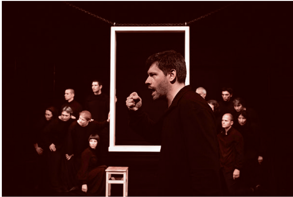
Сцена из спектакля «Пастырь»

И вот здесь, кстати, есть определенное напоминание об идее Кургияна, о которой Сергей Ервандович говорил еще лет двадцать назад. Что не сводится мир к двум началам: черному и белому, противостоящим друг другу. Да, белое — это не зло, но белое бессильно в борьбе с агрессивностью зла. Зло агрессивно, но оно — зло. И побеждает тот, на чьей стороне оказывается красный огонь. В спектакле «Пастырь» красный огонь превратился из просто метафори-