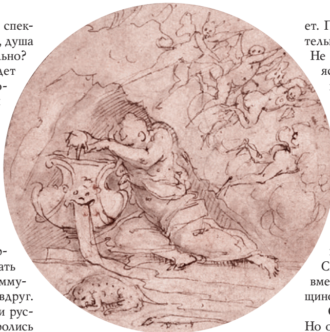
Джорджо Вазари. Аллегория Забвения. Ок. 1570

Но СССР больше нет. Современный россиянин знает от силы лишь имена Ленина, Сталина и Дзержинского, но смутно представляет, кто это, и уж тем более не идет речи о том, чтобы Революция и дело освобождения человека вдохновляли молодежь. Связь практически утеряна. Дело поколений передано забвению.