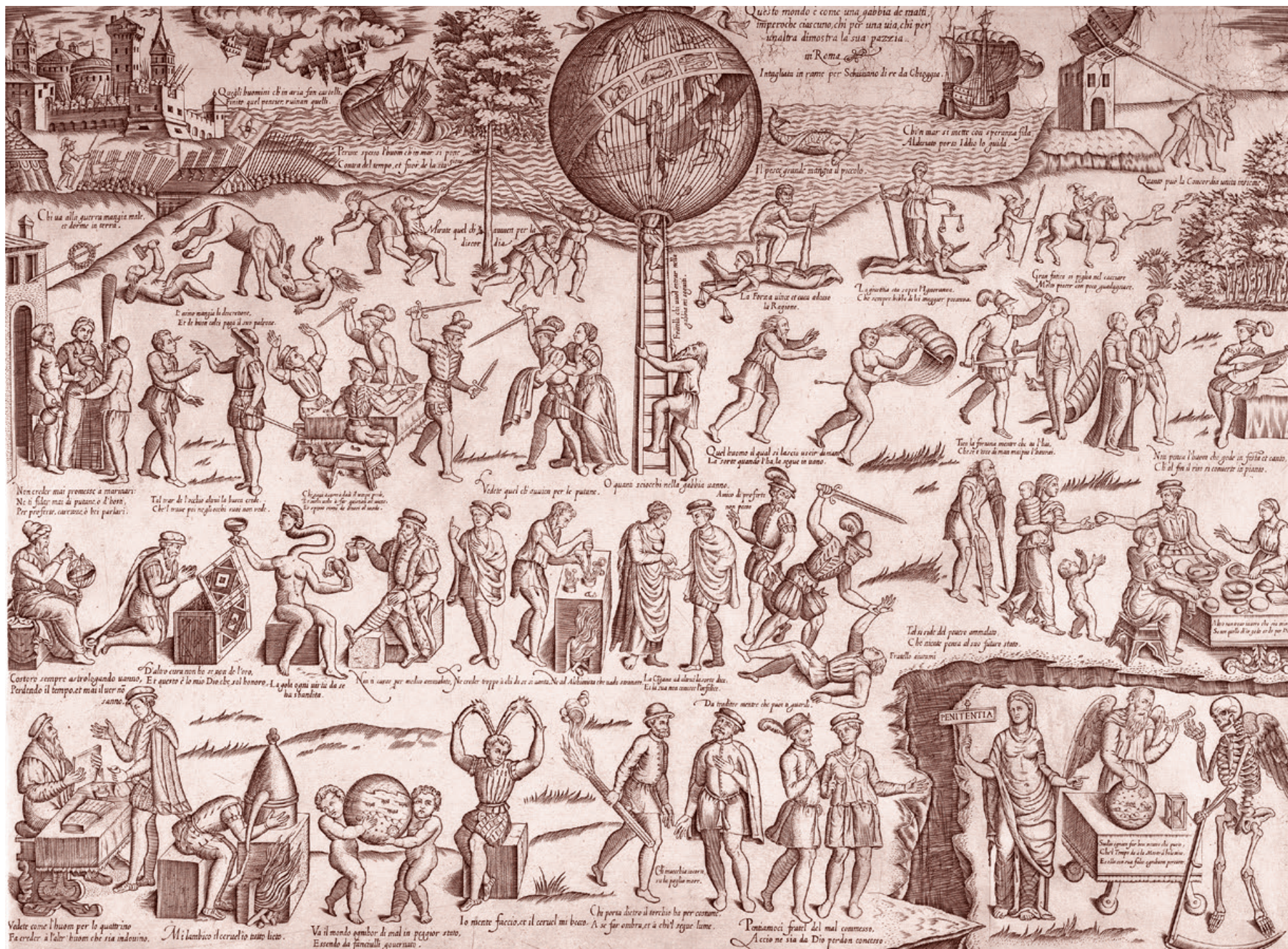
Себастьяно ди Пе. Клетка безумцев (La gabbia de' matti). 1557–1563

Поночевный отметил, что «существует три направления подобной деятельности российской власти. Это принудительное выдворение граждан из Крыма, в том числе по решению суда, факты незаконного перемещения осужденных, которые на момент 2014 года находились в местах лишения свободы в Крыму, на территорию России, и факты колонизации Крыма российскими гражданами».