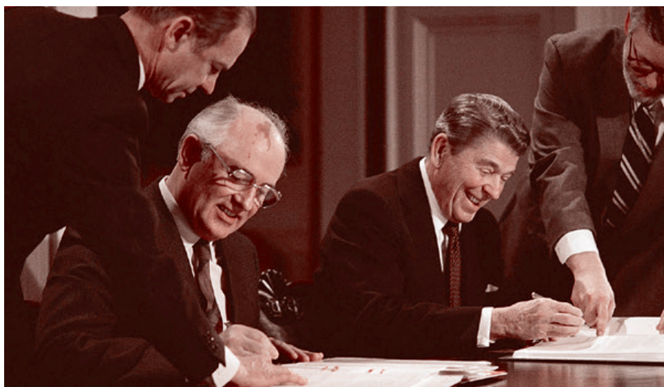
Михаил Горбачев и Рональд Рейган подписывают договор РСМД, 1987

Американские военные восприняли эту идею с большим энтузиазмом, и 17 августа 1973 года министр обороны США Джеймс Шлезингер объявил, что данный подход стал новой основой ядерной политики страны. В следующем году идея «обезглавливающего удара» была закреплена в ключевых документах, определяющих американскую ядерную стратегию. Американские стратеги включили в приоритеты развития ядерных сил создание и развертывание ракетных комплексов средней и меньшей дальности. Реализовывая свою доктрину, американцы начали формирование в Западной Европе системы